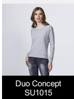
Duo Concept SU1015