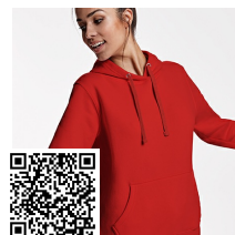
URBAN WOMAN SU1068