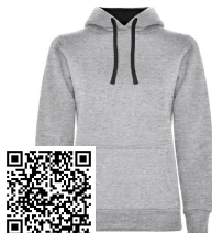
URBAN WOMAN SU1068