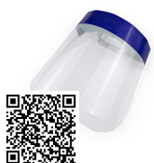
COHN MASCARA FACIAL SA9905