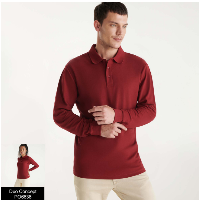
Duo Concept PO6636