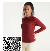
ESTRELLA WOMAN L/S PO6636