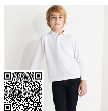
CARPE CHILD PO5008