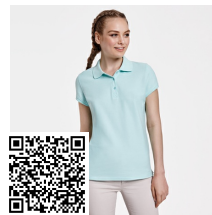
STAR WOMAN PO6634