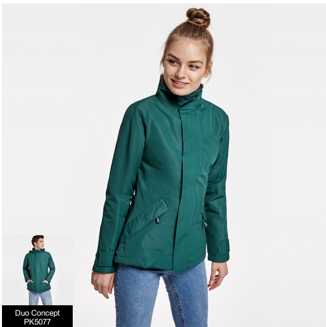
Duo Concept PK5077