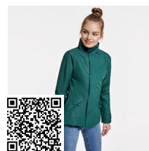
EUROPA WOMAN PK5078