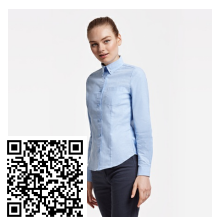
OXFORD WOMAN CM5068