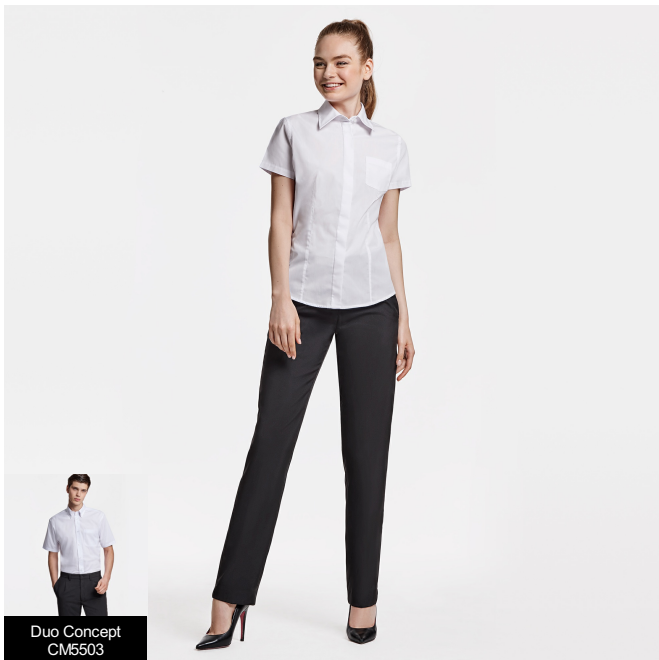
Duo Concept CM5503