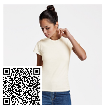
BASSET WOMAN CA6686