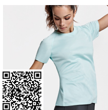
BAHRAIN WOMAN CA0408