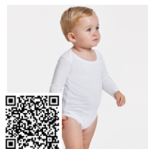
HONEY L/S BD7202