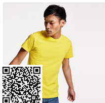
DOGO PREMIUM CA6502