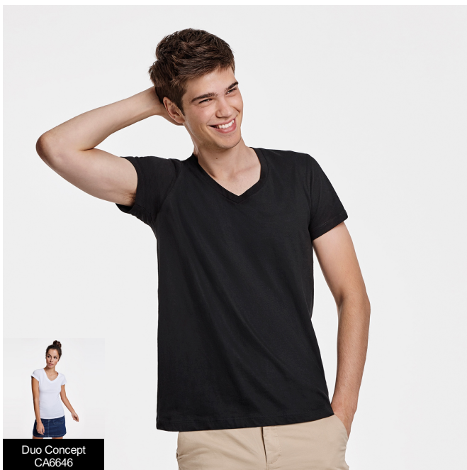
Duo Concept CA6646