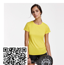
MONTECARLO WOMAN CA0423