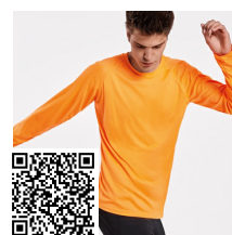
MONTECARLO L/S CA0415