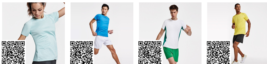
BAHRAIN WOMAN CA0408