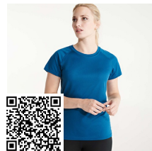
BAHRAIN WOMAN CA0408