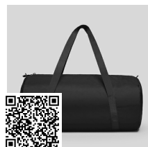
PLEGABLE FOLD BO7116